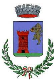
Comune di Laconi