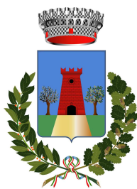
Comune di Cuglieri