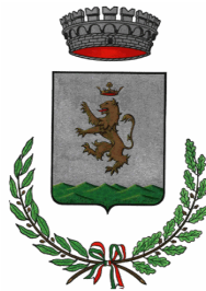
Comune di Orani