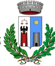
Comune di Sedilo