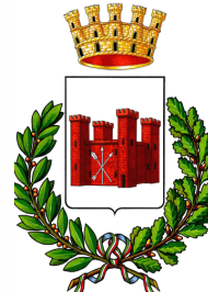
Comune di Sanluri