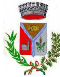
Comune di Villasor